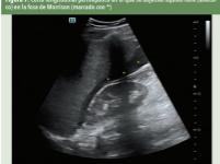
Figura 7. Corte longitudinal perihèptica en el que se objectiva líquid lliure (anecoic) en la fossa de Morrison (marcada con *)